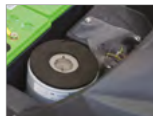
3-STOPNIOWY SILNIK SSĄCY