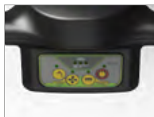
ZAPROGRAMOWANE TRYBY PRACY